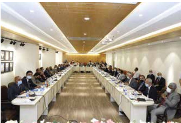
Partial view of the participants of the Annual Conference-2021 held on 27th February, 2021

According to a report published by the concerned authority, the government announced Tk. 121,353